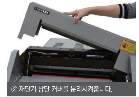
② 재단기 상단 커버를 분리시켜줍니다.