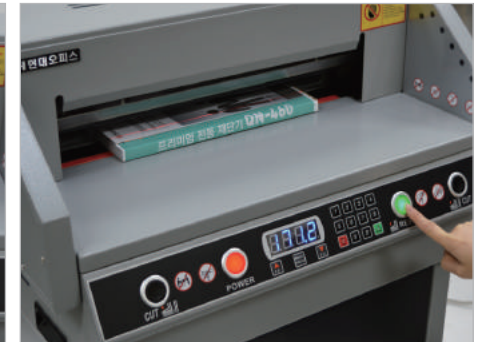
④ 레이저로 표시되는 재단부분을 확인한 후 리셋버튼을 눌러줍니다.