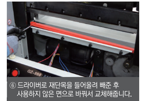
⑥ 드라이버로 재단목을 들어올려 빼준 후 사용하지 않은 면으로 바꿔서 교체해줍니다.