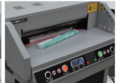
⑥ 재단완성! 압착판이 누르고 있는 종이 사용될 부분, 바깥쪽 재단된 종이 폐기될 부분입니다.