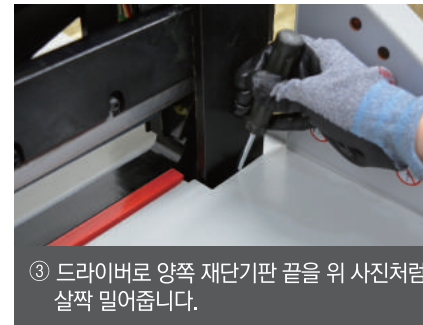
③ 드라이버로 양쪽 재단기판 끝을 위 사진처럼 살짝 밀어줍니다.