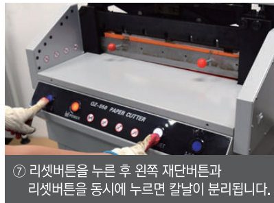
⑦ 리셋버튼을 누른 후 왼쪽 재단버튼과 리셋버튼을 동시에 누르면 칼날이 분리됩니다.