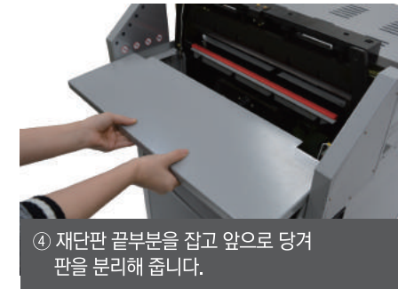
④ 재단판 끝부분을 잡고 앞으로 당겨 판을 분리해 줍니다.