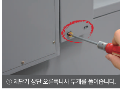
① 재단기 상단 오른쪽나사 두개를 풀어줍니다.