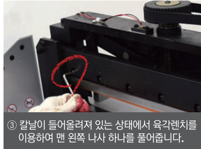
③ 칼날이 들어올려져 있는 상태에서 육각렌치를 이용하여 맨 왼쪽 나사 하나를 풀어줍니다.