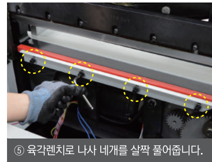
⑤ 육각렌치로 나사 네개를 살짝 풀어줍니다.