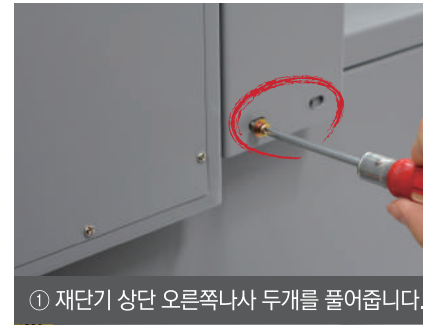
① 재단기 상단 오른쪽나사 두개를 풀어줍니다.