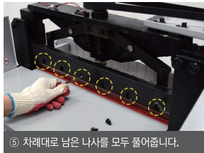
⑤ 차례대로 남은 나사를 모두 풀어줍니다.