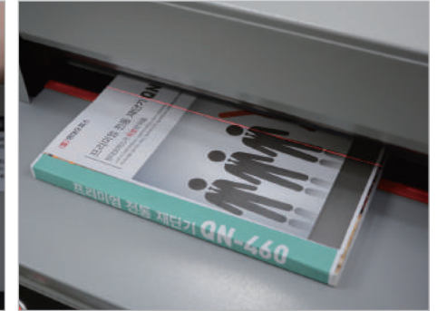
② 재단할 원고를 투입구에 넣어주세요.