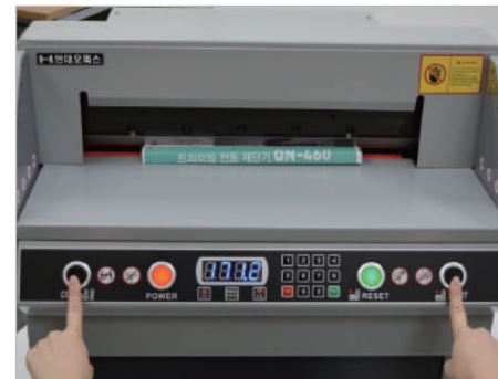
⑤ 양 옆의 검색색 재단버튼을 동시에 눌러 재단합니다.