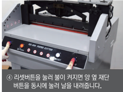
④ 리셋버튼을 눌러 볼이 커지면 양 옆 재단 버튼을 동시에 눌러 날을 내려줍니다.