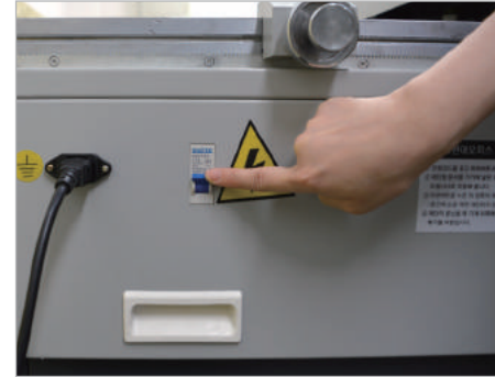
① 기기 왼쪽에 있는 전원코드를 연결하고, 전력차단 스위치를 켜 주세요.