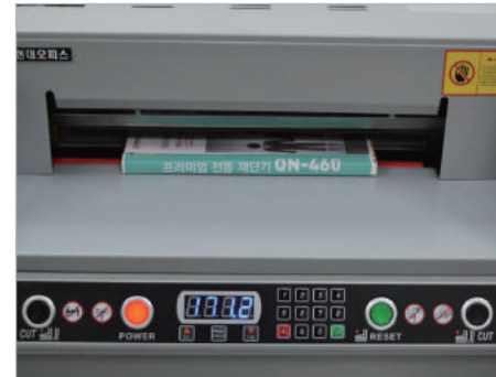
③ 방향키 또는 숫자키를 이용하여 원하는 재단사이즈에 맞게 페이퍼가이드를 조절해 줍니다.