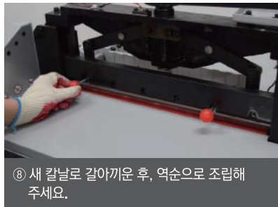
⑧ 새 칼날로 갈아끼운 후, 역순으로 조립해 주세요.