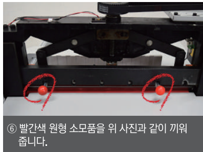
⑥ 빨간색 원형 소모품을 위 사진과 같이 끼워 줍니다.